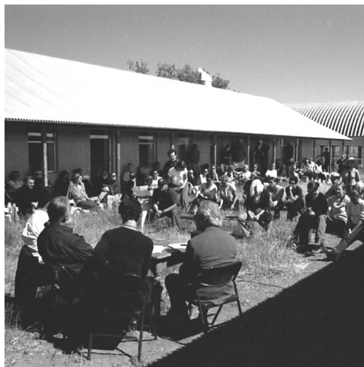
THE CONVERSATION WAS HELD IN THE COURTYARD OF CHINATI'S TEMPORARY EXHIBITION BUILDING.

MS: ¿Así que no hay dibujos antes de construir una pieza?